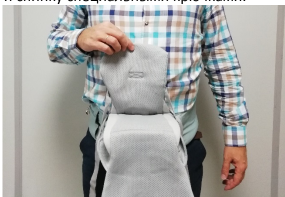
13) Прижмите заднюю часть спинки к себе, чтобы ребёнок сидел посередине.