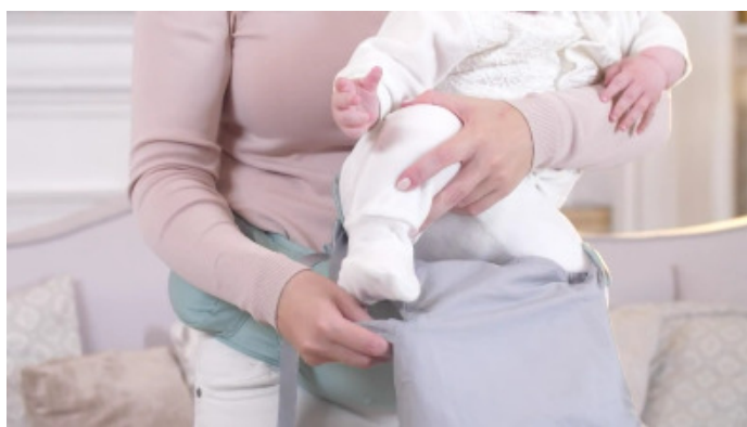
12) Придерживая ребёнка посадите его на сиденье (в выбранном положении), ножки ребёнка разведите в стороны.