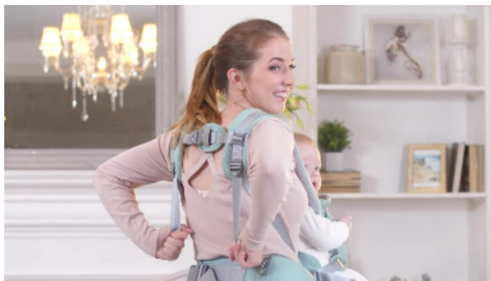
16) Возьмитесь руками за плечевые ремни и потяните вниз, чтобы изделие село по размеру.