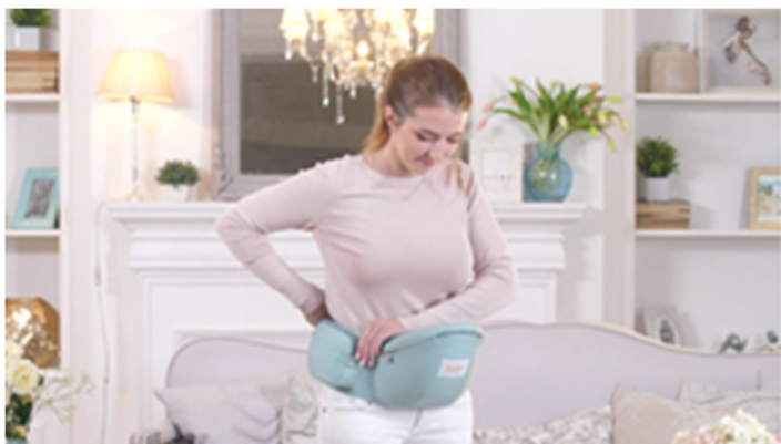
7) Переверните пояс сиденьем к животу.