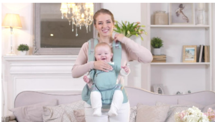
13) Придерживая ребенка наденьте сначала одну лямку, затем другую.