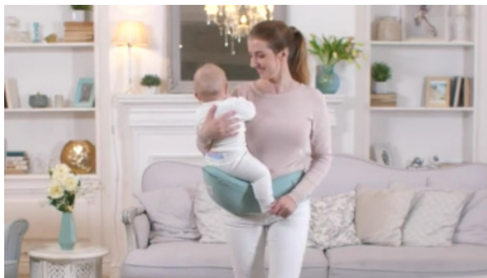
8) Вы можете использовать хипсит (пояс).