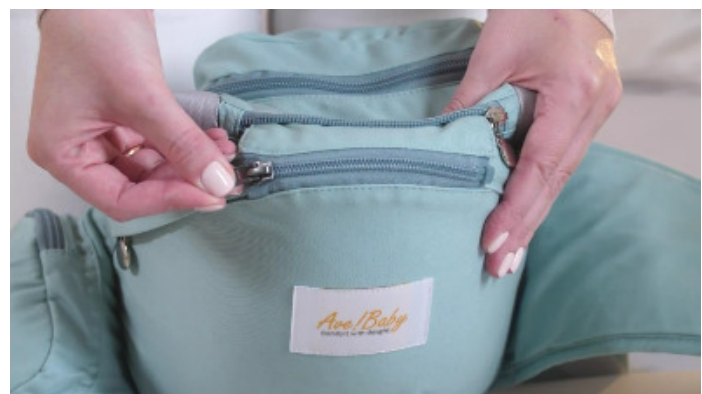
10) Пристегните пояс и спинку молнией.