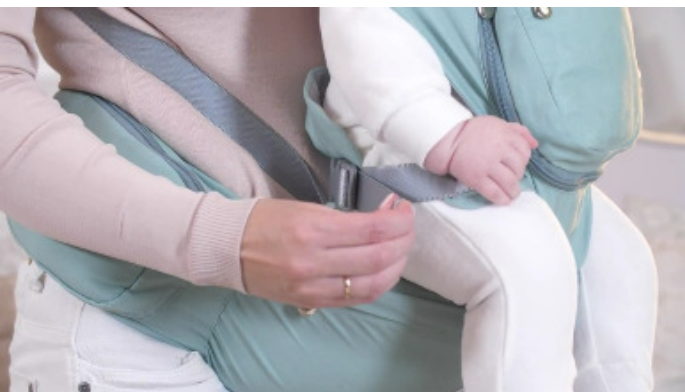
17) Затяните передние ремни, чтобы надежно зафиксировать положение ребёнка.